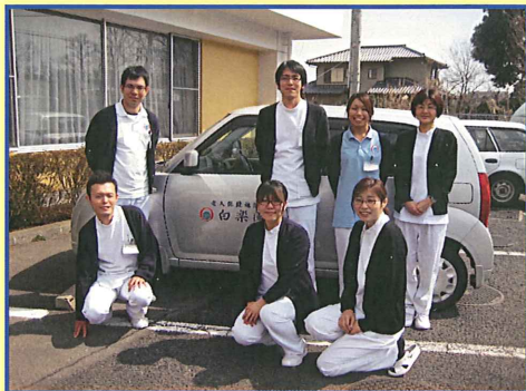
私たちがお手伝いします！！